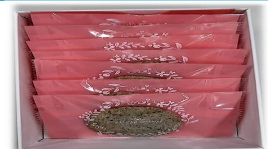
學生親手烘焙的芝麻餅乾。

學校設置開心農場，老師指導學生學習蔬菜的栽種，並將成品製作成可口的餐食。(如摘種芝麻，收割種子，於家政課烘焙餅乾)。