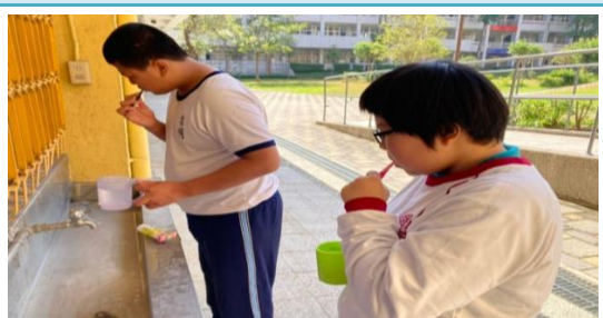
飯前洗手，飯後刷牙漱口。