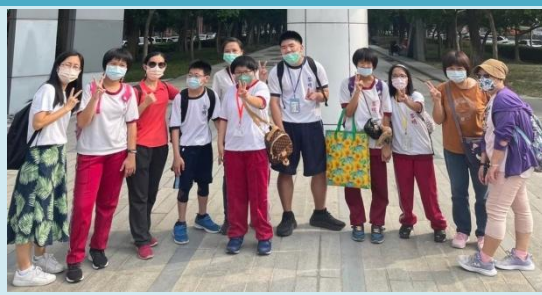
團隊帶領參觀臺中科學博物館。