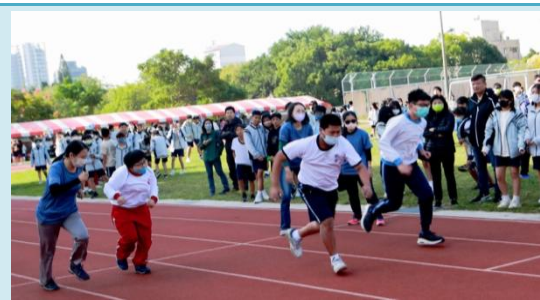
全校師生一起為孩子加油打氣。