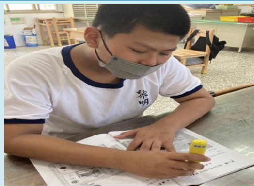
教師用心指導，差異化教學。