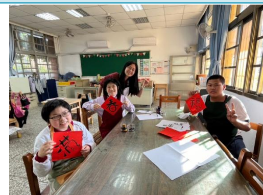
配合節慶設計美術課程。