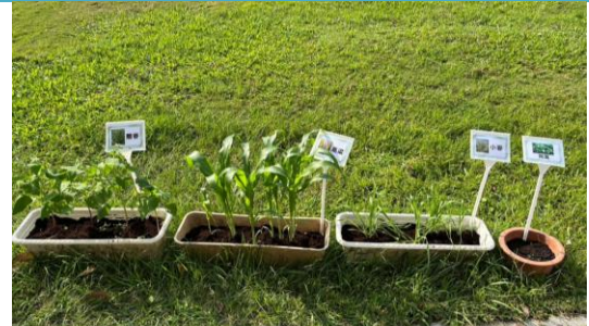
悉心照顧開心農場的育苗場。