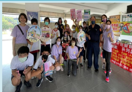
參加防詐騙有獎徵答活動。