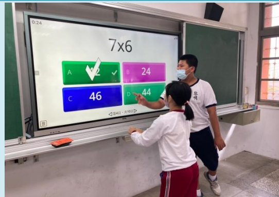
數學課視學生能力，因材施教。