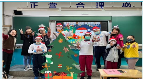
校長、里長頒發幸福糖果。