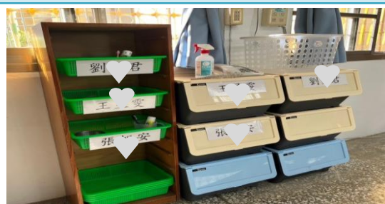
讓孩子養成物歸原處的收納好習慣。