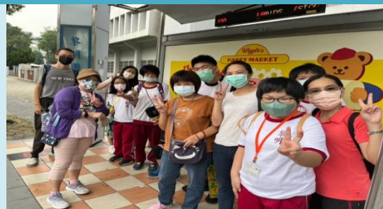
快樂出發，學習搭乘臺中市公車。