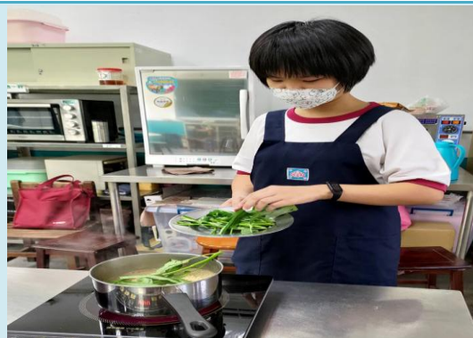
家政課動手做晚餐烹飪課程