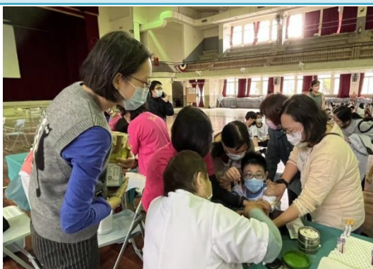
愛的鼓勵，有效安撫學生情緒。

安排特教生參加新生健康檢查、抽血、HPV 疫苗接種，盡力維護學生健康，盡心執行特教新課綱課程，培養學生各項知識、健全發展。