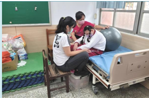
申請各項專業團隊服務。