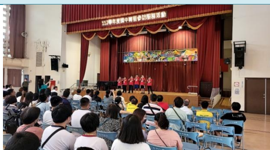
臺中市立特教學校參訪。