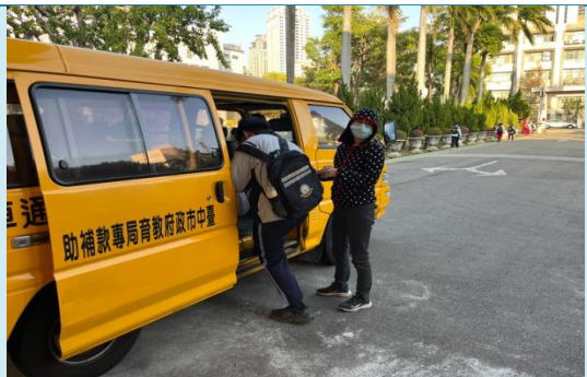
申請上放學交通車接送(由局端審核)。