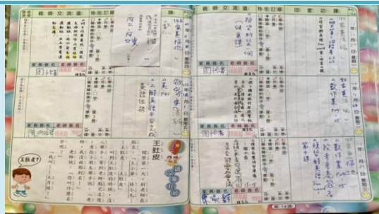
讓家長能有效了解學生日常表現。