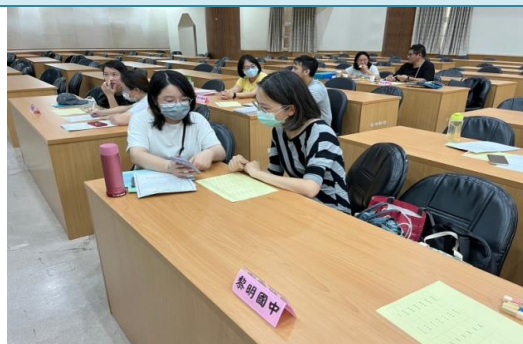
臺中市特殊學校轉銜會議。