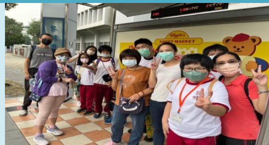
快樂出發，學習搭乘臺中市公車。