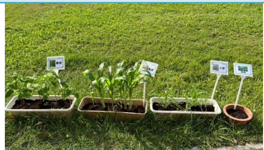
悉心照顧開心農場的育苗場。