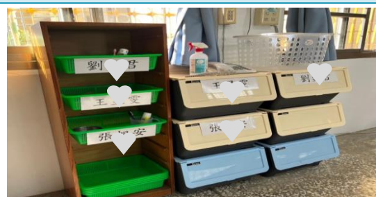
讓孩子養成物歸原處的收納好習慣。