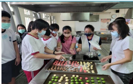
臺中市立啟聰學校參訪。

透過特殊學校及綜合職能科協助孩子找到喜歡的職種和學校，召開轉銜會議和家長討論孩子適合的升學管道。