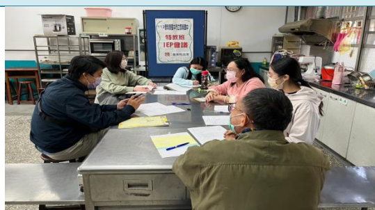
與家長商議未來高中端的就讀學校。