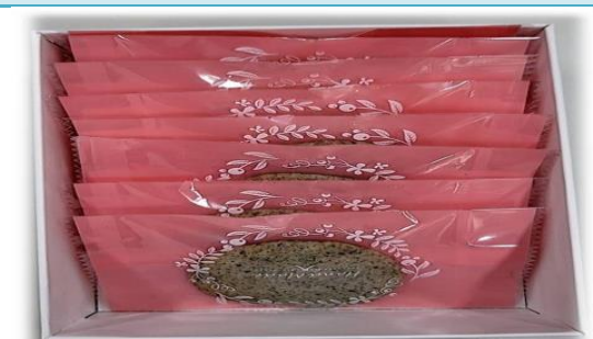
學生親手烘焙的芝麻餅乾。

學校設置開心農場，老師指導學生學習蔬菜的栽種，並將成品製作成可口的餐食。(如摘種芝麻，收割種子，於家政課烘焙餅乾)。